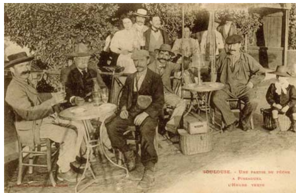
Abbildung 3: Toulouse L'Heure Verte

Im Absinthgenuss zur nachmittäglichen "grünen Stunde" war sich jedenfalls ganz Frankreich einig. Überall widmeten sich Bürger wie Arbeiter dem typischen Trinkritual: Auf das Glas mit einer kleinen Menge tiefgrünem Absinth wurde ein eigens zu diesem Zweck angefertigter perforierter Löffel gelegt, darauf ein Stück Würfelzucker. Langsam beträufelte man den Zucker mit kaltem Wasser und wartete darauf, dass die Flüssigkeit im Glas von klarem Grün in trübes Weiß umschlug. 9 In größeren Bars machten Absinth-Brunnen mit zahlreichen Wasserhähnen das Ritual zu einem wahrhaft gemeinschaftlichen Erlebnis.