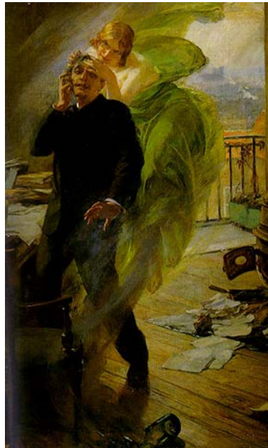
Abbildung 6: Albert Maignan: La fée verte (1895)