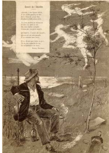
Abbildung 5: Raoul Ponchon, "Sonnet de l'Absinthe", Illustration von Pierre Morelin: Le Courier Francais 1886, http://www.oxygenee.com/images/Ponchon-Pierre-Morel-100KB.jpg

Der Humorist Alphonse Allais thematisiert andere Wirkungen. In seiner Kurzerzählung "Absinthes" (1885 in der eigenen Zeitschrift des berühmten Cabarets Le chat noir veröffentlicht), lässt er einen erfolglosen Schriftsteller beim Absinth das Pariser Straßenleben ungefiltert wahrnehmen und vom einzigartigen, unvergesslichen und erfolgreichen Buch phantasieren. Am Ende wird aber doch nur ein weiterer Absinth bestellt.