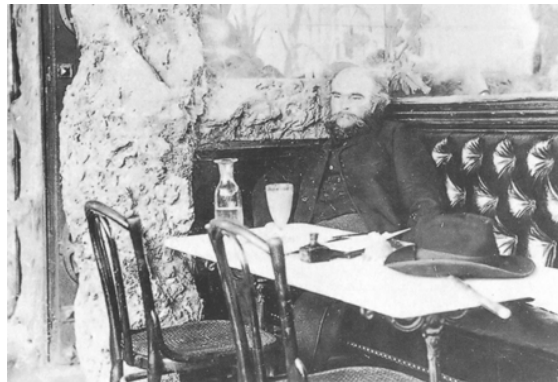
Abbildung 4: Paul Verlaine (1896)

Doch eine ganze Reihe dieser Bohemiens beließ es nicht beim gelegentlichen Absinthgenuss, sondern machte den schrankenlosen öffentlichen Absinthismus zur Lebensform, zum sinnfälligen Ausdruck der Opposition gegen bürgerliche Werte und Konventionen. Für die Lebenspraxis entscheidend war aber wohl nach gewisser Zeit die schlichte Abhängigkeit vom Alkohol. Da bot der hochprozentige Likör das beste Preis-Leistungsverhältnis. Dichter wie Paul Verlaine und Alfred Jarry, Maler wie Henri Toulouse-Lautrec und Vincent van Gogh waren bekannte "absintheurs". Ihre unter dem Einfluss der grünen Fee verübten Exzesse skandalisierten die Öffentlichkeit. Die wüsten Trinkgelage von Verlaine und seinem jungen Geliebten, dem Dichter Arthur Rimbaud, die schließlich in Verlaines Mordversuch an Rimbaud gipfelten, oder Jarrys Fahrradtouren durch Paris, für die er sich zu Ehren des Absinth nackt auszog und am ganzen Körper grün bemalte, bildeten beliebte Klatschthemen.