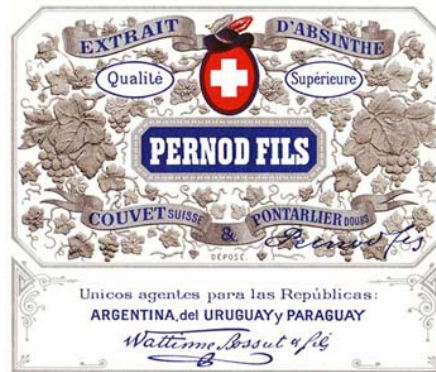
Abbildung 8: Wattime Bossut, Pernod-Reklame für Argentinien, Uruguay und Paraguay (o.O., o.J.), http://www.oxygenee.com/images/Pernod-Argentina-55KB.jpg