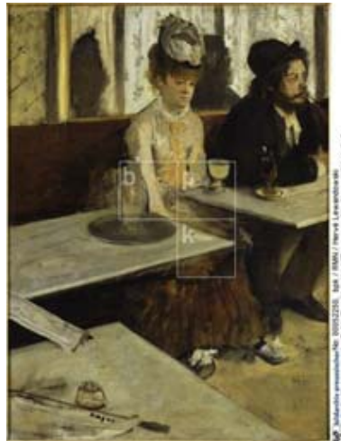
Abbildung 1: Edgar Degas, Der Absinth (1876, Paris, Musée d'Orsay) (Bildarchiv Preußischer Kulturbesitz, bpk)

http://bpkgate.picturemaxx.com/preview.php?WGSESSID=05984e5d598cab07d42788d072304ce5&UURL=e7c78c36b4296bb190df8c82e64b928e&IMGID=00052250