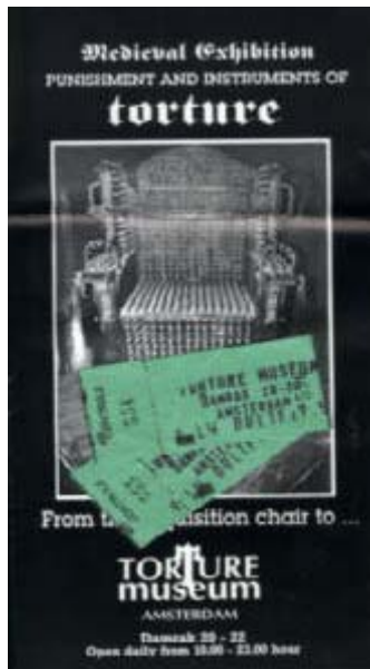
Vergrößern (272 KB)

Zu den Folterinstrumenten, die auf Grund ihrer Größe und ihres Erscheinungsbildes besonders spektakulär wirken, gehört der Folterbeziehungsweise Stachelstuhl. Es handelt sich um einen Stuhl, dessen Sitzbrett sowie dessen Lehne und Armstützen mit spitzen Stacheln besetzt sind. Ein solcher Stuhl ist beispielsweise auf dem Titelblatt der Publikation über die Sammlung des Museums in San Gimignano abgebildet.[8] Eine etwas veränderte Variante des Stuhls steht auf der Vorderseite eines Folders, mit dem das "Torture Museum" in Amsterdam für den Besuch wirbt.[9] Eine weitere Variante des Stuhls bildet das Plakatmotiv der Sonderausstellung "Mittelalterliche Folterwerkzeuge". Auch im "Mittelalterlichen Foltermuseum" Rüdesheim oder in dem als privates Museum betriebenen Folterturm in Burghausen sind solche Stühle zu sehen.