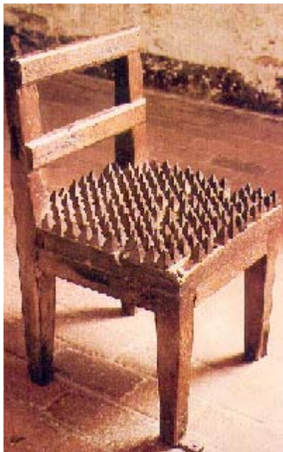
Vergrößern (80 KB)

Im Jahre 1985 wurde der Stuhl über das Lemgoer Heimatmuseum hinaus bekannt. Als Leihgabe war er in der niedersächsischen Landesausstellung "Stadt im Wandel" zu sehen, wo er dem Bereich "Rathaus und Politik. Justiz und Strafe" zugeordnet war. In der Ausstellung wurde er als "Folterstuhl aus Lemgo, 17. Jh." beschrieben.[43] Zwar wurde im Katalogtext darauf hingewiesen, dass es keine Quelle für die Anwendung des Stuhles gab. Deshalb habe er vermutlich "vorwiegend der Verbalterriton", das heißt der Einschüchterung, gedient. Aber an der Authentizität des Stuhls gab es keinen Zweifel: "Man weiß nur, daß er 1632 als Bedenkstuhl oder Marterstuhl - andernorts auch Marterkissen, spanischer Sitz, Lüneburger Stuhl, Beichtstuhl, Angststuhl, Jungfernsessel genannt - von der Stadt in Auftrag gegeben und gekauft worden ist."[44] Auch in der stadt- und regionalgeschichtlichen Literatur zum Rechtswesen und zur Kriminalgerichtsbarkeit wurde die Originalität des Stuhls nicht in Frage gestellt. Während Wolfgang Schild in seiner Darstellung der Lemgoer Kriminalgerichtsbarkeit davon ausging, dass der Stuhl nicht zur Anwendung kam,[45] wurde in einem Ausstellungskatalog zum Rechtswesen in Ostwestfalen-Lippe die These Antzes übernommen, der Verhörte habe bei der Folter im Folterstuhl gesessen.[46] Erst eine