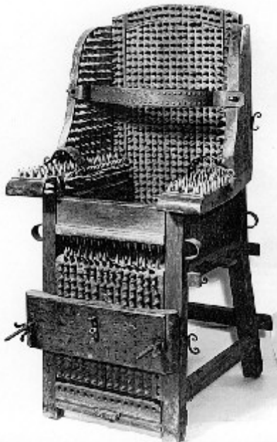
Vergrößern (85 KB)

Folterstühle sind nicht nur in Museen mit rechtsgeschichtlichen Sammlungen, sondern auch in kulturgeschichtlichen Ausstellungen zu sehen. In einer Ausstellung des "Museums für Gestaltung" zu Basel wurde der Lemgoer Folterstuhl als "sprechender Gegenstand" präsentiert, ähnlich wie ein Frisierstuhl, ein Schiedsrichterstuhl oder eine Wartebank.[17] Auch im Katalog, den das Deutsche Hygiene-Museum Dresden zur Ausstellung "Sitzen" herausgebracht hat, findet sich die Abbildung eines Folterstuhls.[18] Da es sich bei den Folterstühlen um große, auffallende Objekte handelt, ziehen sie die Blicke auf sich, wie das Beispiel der Ausstellung "Hexen und Hexenverfolgung im deutschen Südwesten" im Badischen Landesmuseum gezeigt hat. Entgegen der Intention der Ausstellungsmacher rückte in der Presseberichterstattung über die Ausstellung des Badischen Landesmuseums der dort gezeigte Folterstuhl, der als Leihgabe aus dem Bayerischen Nationalmuseum in München stammte, in den Mittelpunkt. An Stelle der vom Museum herausgegebenen Pressefotos wurde von vielen Zeitungen ein Foto verbreitet, auf dem eine langhaarige junge Frau vor dem Folterstuhl hockte.[19]