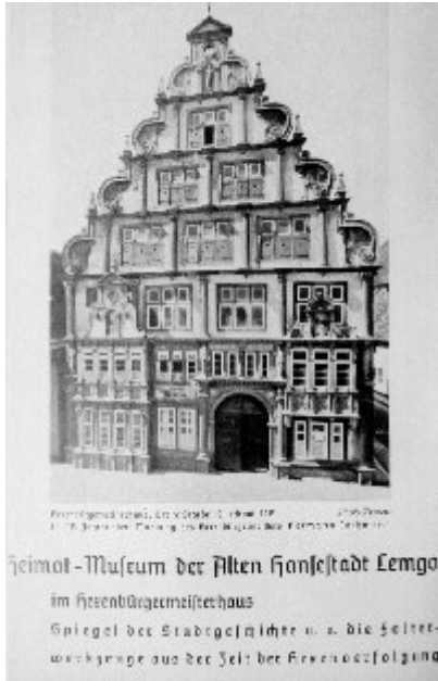
Vergrößern (78 KB)