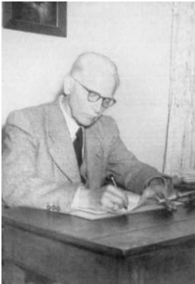
Vergrößern (22 KB)

In dem Zeitungsartikel, der zur Eröffnung erschien, wurde die Präsentation der Folterwerkzeuge besonders hervorgehoben: "Ohne Zweifel wird eben dieser Teil der Sammlung, die Schreckenskammer, auf die fremden Besucher Lemgos die stärkste Anziehungskraft ausüben." Der Verfasser, der promovierte Gymnasiallehrer Karl Meier , beschrieb auch die Vorgehensweise bei der Präsentation der Objekte: "So sind denn die vorhandenen Reste der Folterwerkzeuge aufgrund der exakten Abbildungen, die wir von sämtlichen in Lemgo angewandten Peinigungsmitteln besitzen, glücklich ergänzt worden."[35] Als Nachbau war damit auch der Folterstuhl zum Bestandteil der Ausstellung geworden. Eine Unterscheidung zwischen den Originalen, die im Besitz der Scharfrichterfamilie überliefert waren, und den Nachbauten, dem Folterstuhl und der ebenfalls nachgebauten Streckleiter, wurde in der Ausstellung nicht vorgenommen. Von daher fiel dieser Unterschied auch den Besuchern nicht auf. Aus einem Objekt, dessen erste Beschreibung sich auf eine mündliche Überlieferung stützte, und über dessen Verwendung es keine Quellenbelege gab, wurde ein Ausstellungsgegenstand in einer Museumsinszenierung, von der eine besondere Suggestivkraft