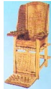
Vergrößern (29 KB)

Zu den Folterinstrumenten, die auf Grund ihrer Größe und ihres Erscheinungsbildes besonders spektakulär wirken, gehört der Folterbeziehungsweise Stachelstuhl. Es handelt sich um einen Stuhl, dessen Sitzbrett sowie dessen Lehne und Armstützen mit spitzen Stacheln besetzt sind. Ein solcher Stuhl ist beispielsweise auf dem Titelblatt der Publikation über die Sammlung des Museums in San Gimignano abgebildet.[8] Eine etwas veränderte Variante des Stuhls steht auf der Vorderseite eines Folders, mit dem das "Torture Museum" in Amsterdam für den Besuch wirbt.[9] Eine weitere Variante des Stuhls bildet das Plakatmotiv der Sonderausstellung "Mittelalterliche Folterwerkzeuge". Auch im "Mittelalterlichen Foltermuseum" Rüdesheim oder in dem als privates Museum betriebenen Folterturm in Burghausen sind solche Stühle zu sehen.