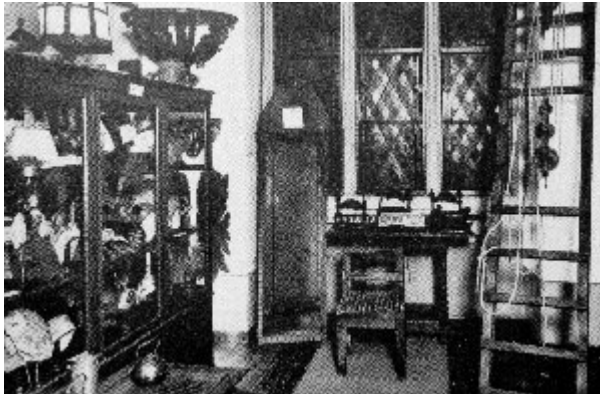
Vergrößern (77 KB)