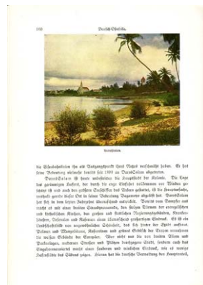
Abb. 1: Robert Lohmeyer (*1879): Daressalam [Deutsch-Ostafrika]. Reproduktion einer Autochromeaufnahme, ca. 1908/09 aufgenommen, publiziert 1909/10 (Scheel, Deutschlands Kolonien ..., S. 100)