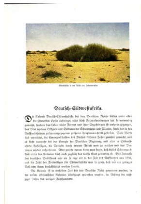
Abb. 9: Robert Lohmeyer (*1879): Milchbüsche in der Wüste bei Jakalswasser [Deutsch-Südwestafrika]. Reproduktion einer Autochromeaufnahme, ca. 1908/09 aufgenommen publiziert 1909/10 (Scheel, Deutschlands Kolonien ..., S. 44)

Anders Aufnahmen, die scheinbar wenig Aussagekraft besitzen, wie die Aufnahme „Milchbüsche in der Wüste bei Jakalswasser“.